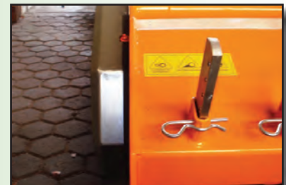
Holzaufnahmezinken (serienmäßig) in stabiler Tasche (herausnehmbar)

Durch die besondere Form der Schlegel mit gezahnter Schneide und die Anordnung der Gegenschneden im Gehäuse wird eine gute Zerkleinerung und Zerfaserung des Mulchgutes erreicht. Die Maschine eignet sich daher auch sehr gut zum Mulchen von Gras, Zwischenfrüchten und Rebholz (bis zu 6cm Ø). Die Holzaufnahmezinken sind Bestandteil der Serienausstattung.