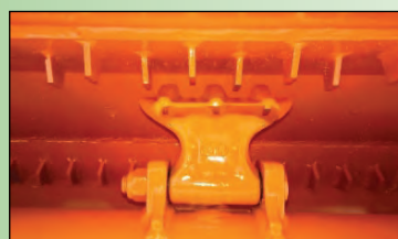
Gegenschneden im Gehäuse