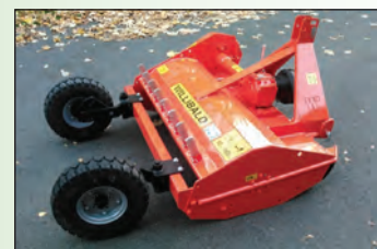
verstärkte Version mit Laufrädern