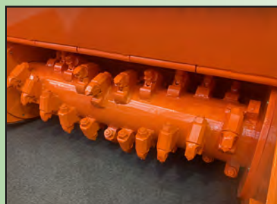
Rotor mit festen Werkzeugen

Der Mulchkopf ist serienmäßig mit einer hydraulischen Fronthaube mit Kettenschutz ausgestattet sowie mit massiv ausgeführten Gleitkufen. Durch die besondere Form der durchschwingenden wendbaren Forstschlegel mit gerader Schneide und der Gehäuseform wird auch bei Gras und leichtem Gestrüpp eine gute Zerkleinerung des Mulchgutes erreicht. Alternativ kann ein Rotor mit festen Werkzeugen montiert werden. Hierbei gibt es zwei verschiedene Ausführungen: massiver Hartmetallzahn für steinige Böden und Fräsarbeiten oder aggressive Hartmetallschneidzähne für eine gute Zerkleinerung von Schilf und Gestrüpp. Die Maschine eignet sich zum Mulchen von Gras, Gestrüpp und Holz bis zu ca. 15 cm Ø.