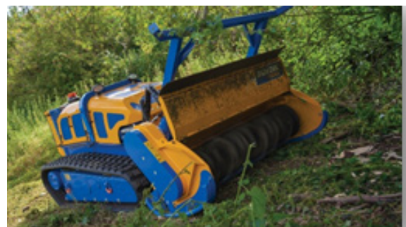
Flailbot Supreme mit Forstmulchkopf