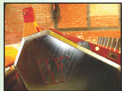
Schrägliegender Keilriemenantrieb, dadurch geringere Bauhöhe