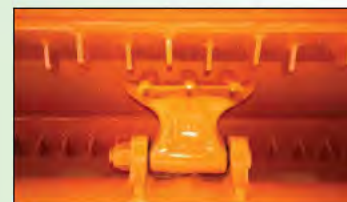
Gegenschneiden im Gehäuse

hydraulische Handpumpe anstelle von Schlepperanschluss