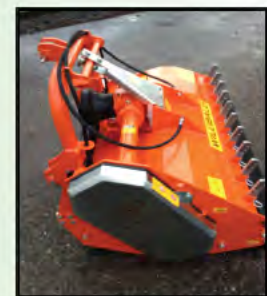
Schrägliegender Keilriemenantrieb, dadurch geringere Bauhöhe